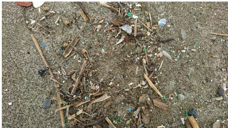
↑ 砂と自然物に紛れたプラスチック片 (マイクロプラスチック)