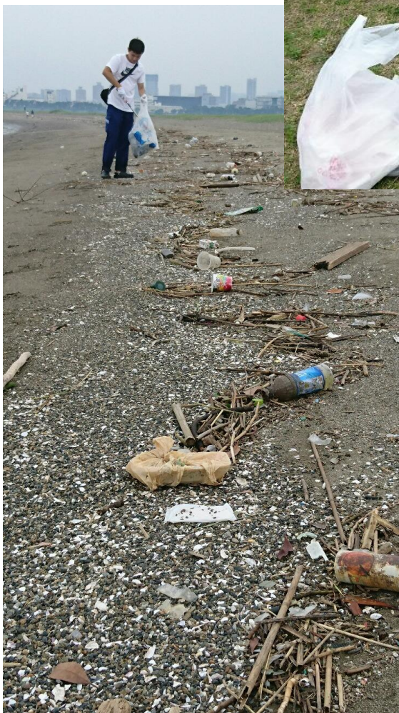
⇐ ↑ ↓ こんなにゴミがありました